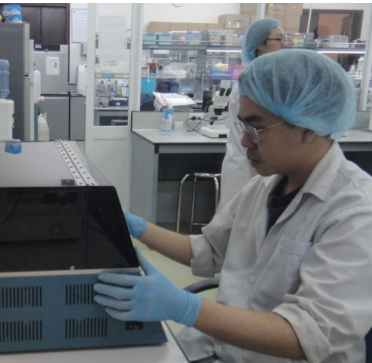
Hoạt động nghiên cứu khoa học tại Đại học Quốc gia Thành phố Hồ Chí Minh

Quỹ có các mục tiêu dài hạn: Dự kiến đầu tư vào 50 đến 150 doanh nghiệp khởi nghiệp sáng tạo, doanh nghiệp khoa học, công nghệ cao trong giai đoạn 2026-2035. Hỗ trợ thương mại hóa ít nhất 50 sản phẩm/công nghệ và ươm tạo tối thiểu 5 doanh nghiệp công nghệ quy mô lớn.