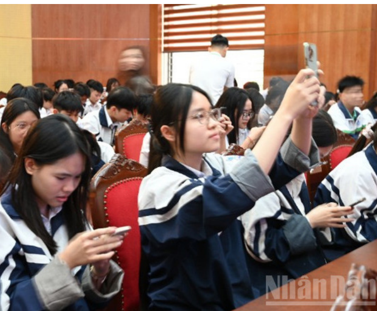
Học sinh hào hứng tham gia quét mã QR để tham gia chương trình khởi nghiệp của trường Học viện Nông nghiệp Việt Nam

Với những thành tích nổi bật trong đào tạo, nghiên cứu khoa học và hợp tác quốc tế, Học viện đã được Đảng, Nhà nước trao tặng nhiều phần thưởng cao quý như Huân chương Hồ Chí Minh, danh hiệu Anh hùng Lao động và Anh hùng Lao động thời kỳ đổi mới.