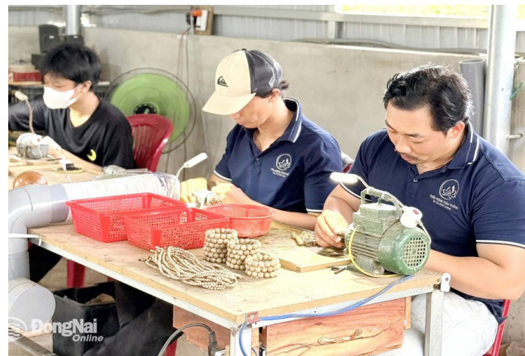
Sản xuất tại Cơ sở Trâm hương Toàn Thắng (phường Long Khánh)

N ghị quyết 68-NQ/TW, ngày 4-5-2025 của Bộ Chính trị về phát triển kinh tế tư nhân đặt mục tiêu Việt Nam đạt con số 2 triệu doanh nghiệp (DN) vào năm 2030. Bên cạnh các DN được nhà đầu tư đổ vốn thành lập mới thì nguồn lực khoảng 5 triệu hộ kinh doanh được kỳ vọng sẽ có sự bổ sung đáng kể khi mạnh dạn chuyển đổi sang mô hình DN.