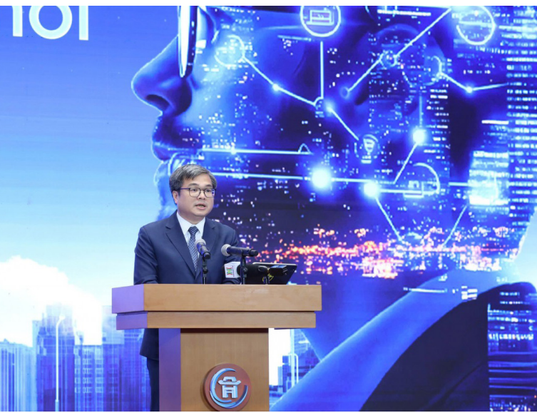
Phó Chủ tịch UBND thành phố Hà Nội Trương Việt Dũng phát biểu tại lễ công bố

Thành phố mong muốn phần vốn nhà nước tại doanh nghiệp được quản lý theo chuẩn mực hiện đại: Minh bạch nhưng không làm nghẽn sáng tạo; kỷ luật tài chính nhưng không triệt tiêu tinh thần dẫn thân; kiểm soát rủi ro nhưng vẫn chấp nhận thử nghiệm trong giới hạn cho phép. Đây cũng là thông điệp về niềm tin vào thể hệ mới - những người sẽ dẫn dắt hệ sinh thái đổi mới sáng tạo của Thủ đô trong tương lai. Thành phố không chỉ giao vốn, mà giao trách nhiệm kiến tạo; không chỉ yêu cầu an toàn vốn, mà kỳ vọng khả năng tổ chức hệ sinh thái.