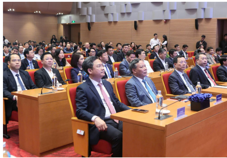
Đại biểu tham dự lễ công bố thành lập Công ty Cổ phần Trung tâm đổi mới sáng tạo Hà Nội

Thứ nhất, đột phá về mô hình thể chế: Lần đầu tiên, Hà Nội thiết kế một tổ chức đổi mới sáng tạo theo cấu trúc công ty cổ phần có vốn nhà nước, nhưng vận hành hoàn toàn theo chuẩn mực quản trị doanh nghiệp hiện đại: Minh bạch tài chính, kiểm soát rủi ro, chịu trách nhiệm trước cổ đông và pháp luật. 70% vốn sở hữu Nhà nước không để kiểm soát vì mô hoạt động kinh doanh, mà bảo đảm phục vụ mục tiêu phát triển Thủ đô. Đánh dấu bước thay đổi căn bản - từ cơ chế cấp phát hành chính sang cơ chế đồng đầu tư và chia sẻ rủi ro; từ hỗ trợ rời rạc sang điều phối hệ sinh thái; từ phong trào khởi nghiệp sang chuỗi giá trị được tổ chức, chuẩn hóa và đo lường bằng kết quả. Khi đổi mới sáng tạo được đặt trong một cấu trúc thị trường rõ ràng, có kỷ luật và có trách nhiệm, mới thực sự trở thành lực lượng sản xuất mới của Thủ đô.