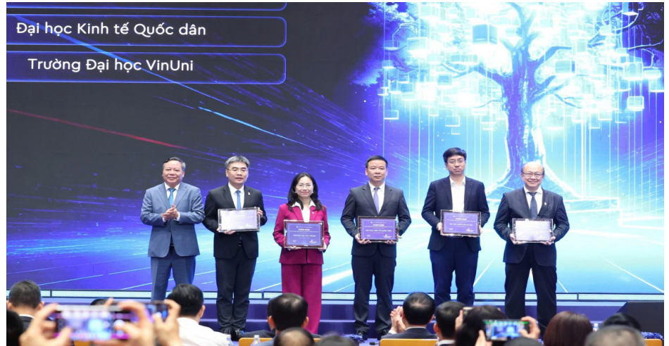
Lãnh đạo thành phố Hà Nội trao chứng nhận cho các đơn vị đồng hành hệ sinh thái đổi mới sáng tạo

chức một hệ sinh thái đổi mới sáng tạo thực chất cho Thủ đô. Thành phố không chỉ giao vốn, mà giao trách nhiệm; không chỉ mong muốn an toàn nguồn lực, mà mong muốn nguồn lực ấy được vận hành hiệu quả, minh bạch và tạo ra giá trị cụ thể cho phát triển kinh tế - xã hội.